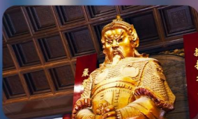
วัดเขงทมิว