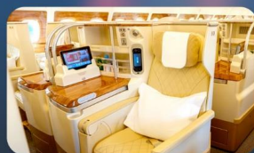
BUSINESS CLASS "บินกลับ"